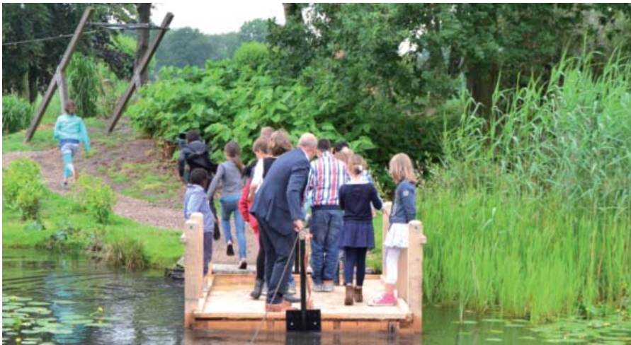
De feestelijke opening van het Schateiland werd een succes. De eerste jongeren steken over naar het Schateiland.