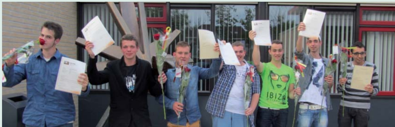
Trotse ATC-leerlingen met hun diploma.